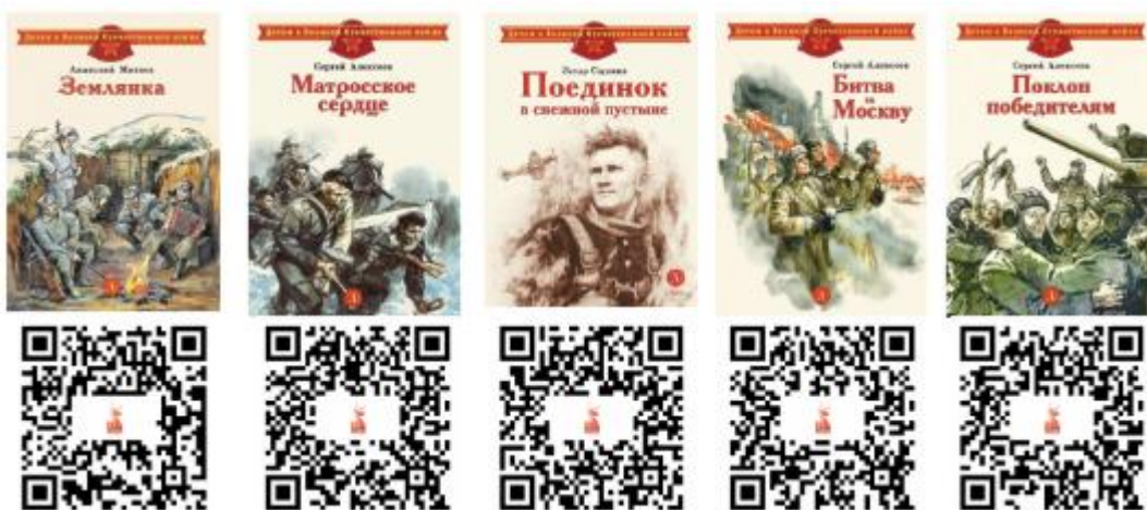
Примеры QR-кодов для таблиц

– QR-коды на источники, название и автор книги (оформленные в виде плакатов в групповых ячейках с перечнем художественной литературы (столбцы таблицы (вариативно) – это перечень книг QR-коды, строки – фамилии и имена детей),