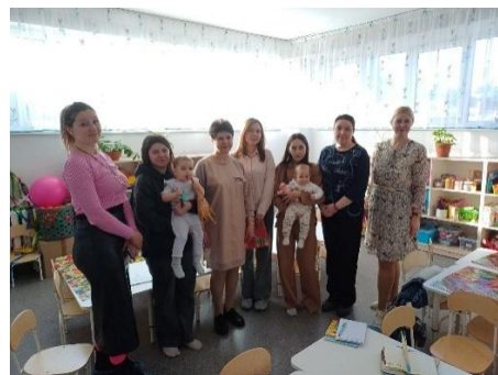
Фото с родительских встреч