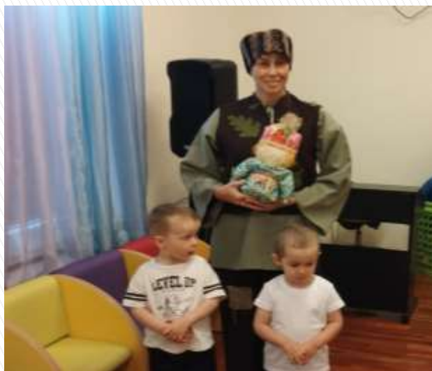
«Подарки Зерновушке и Богачу»